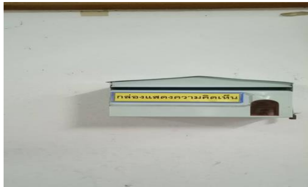
ตู้แสดงความคิดเห็น จุดบริการห้องเก็บเงิน อาคารผู้ป่วยนอก