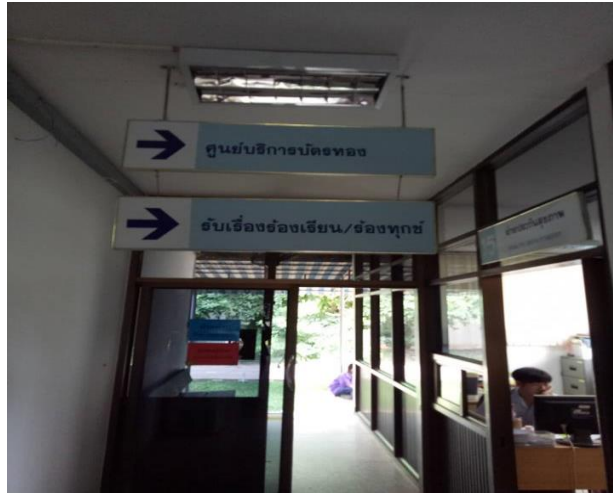
ผู้แสดงความความคิดเห็น จุดบริการงานผู้ป่วยใน อาคารผู้ป่วยใน