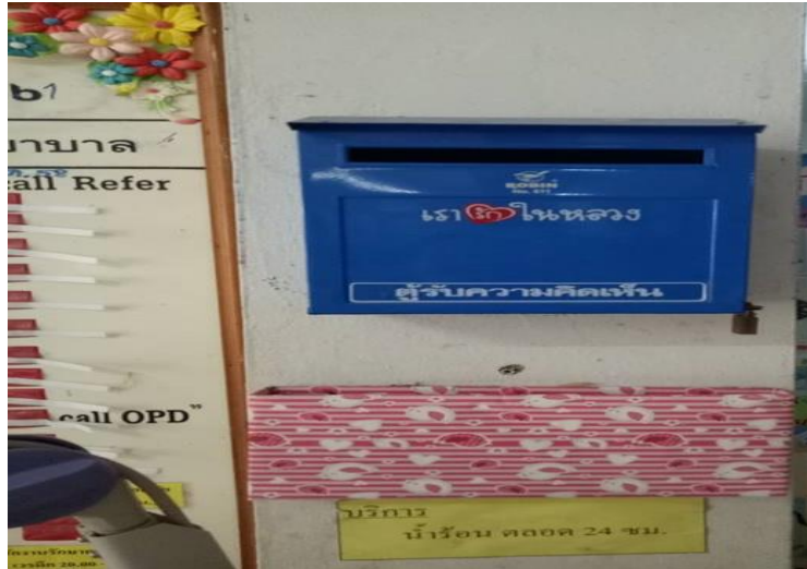
ตู้แสดงความคิดเห็น จุดบริการระหว่างฝ่ายเภสัชกรรมและกลุ่มงานเทคนิคการแพทย์